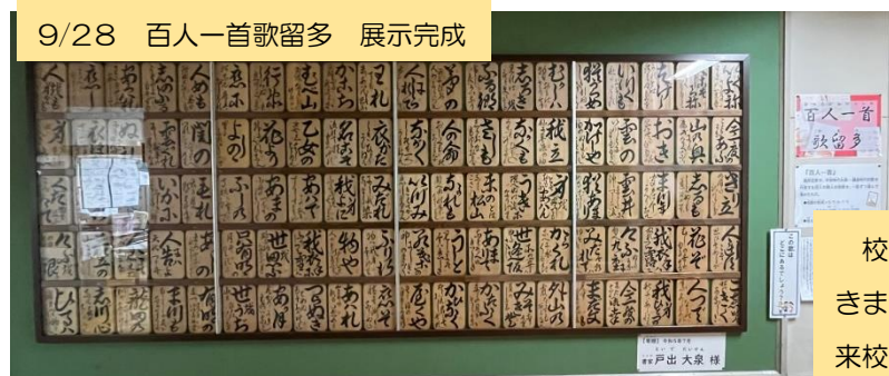
9/28 百人一首歌留多 展示完成

校区の書道家 戸出大泉様からご寄贈いただきました百人一首歌留多の展示が完成しました。来校の際、是非ご鑑賞ください。