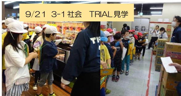
9/21 3-1 社会 TRIAL見学

社会科の「店ではたらく人」の学習のため、TRIAL 帯広東店を見学しました。バックヤードや総菜作り、店内の様子を見学させていただき、教科書だけでは学べない貴重な経験になりました。